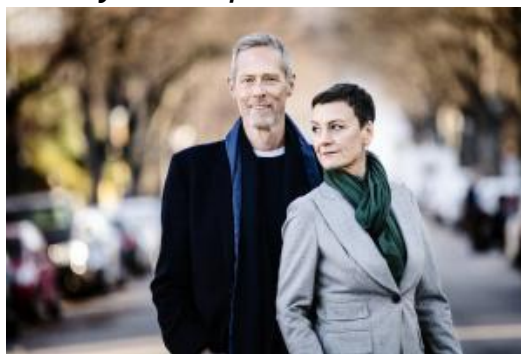
Janni Pedersen og Kim Faber