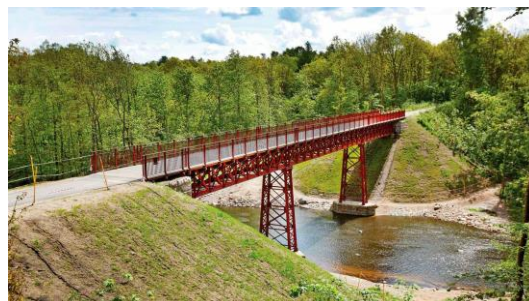
Den Genfundne Bro