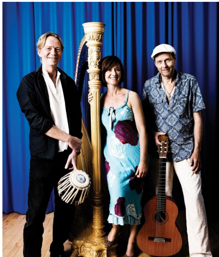
Blue Lotus giver koncert mandag aften