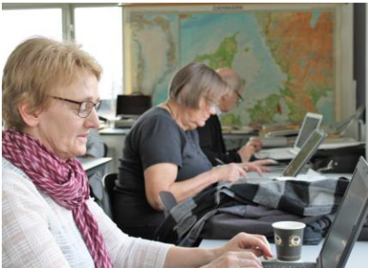
Kursisterne i arbejde