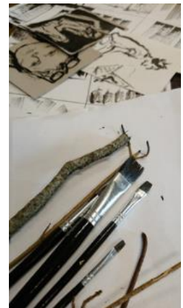
Adelige blomster tegnet af Jens Lund.